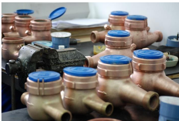
Foto: Contoarele de apă, verificate în programul de scadență metrologică