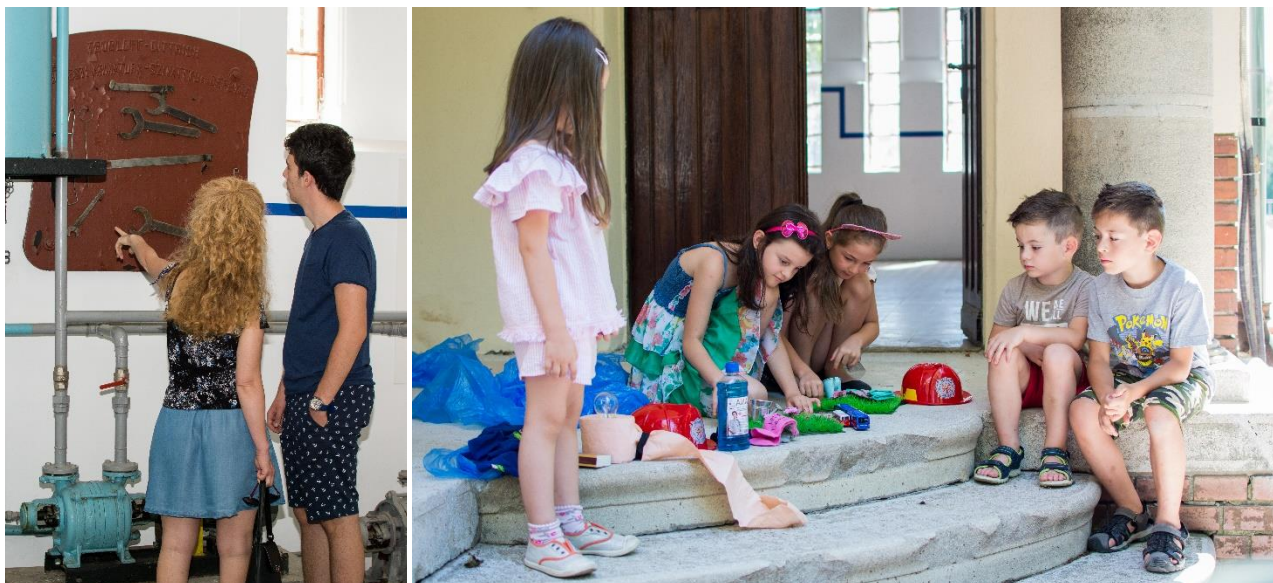
Foto: Programul Descoperiți poveștile apei , la Uzina de apă industrială,