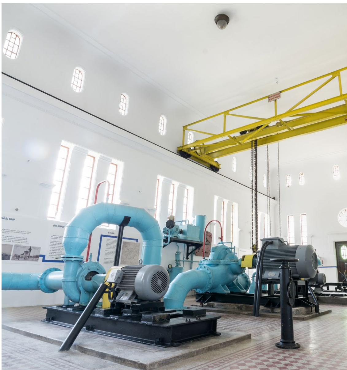
Uzina de Apă Industrială, Sala Mașinilor, Centrul educațional Aquapic Timișoara.

Uzina de Apă nr. 1, din Ciarda Roșie, cunoscută timișorenilor ca „uzina din Urseni”, a dat apă potabilă orașului din 1914 și până în 1991, când a început să funcționeze noua stație de tratare, aflată în imediata vecinătate. Trei clădiri ale vechii uzine - bine conservate și care păstrează fostele utilaje folosite la potabilizarea apei -, și anume Grupul de Fântâni nr. 1, Filtrare-Deferizare și Pompare, vor deveni, în 2021, Muzeul Apei, un loc dedicat prezentării istoriei alimentării cu apă a Banatului, ce va găzdui, de asemenea, manifestări culturale și artistice. Clădirile existente, unde se vor face renovări și se vor amenaja spații vizitabile, vor fi legate printr-o rețea de alei și puncte de interes, bazine decorative, platforme pentru expoziții etc. Proiectul prevede și integrarea unui pavilion nou, pentru primirea vizitatorilor și găzduirea evenimentelor culturale. Construcția Muzeului Apei, o investiție în valoare de circa 5,8 milioane de lei, a început în septembrie 2020 și va fi finalizată în anul 2022.