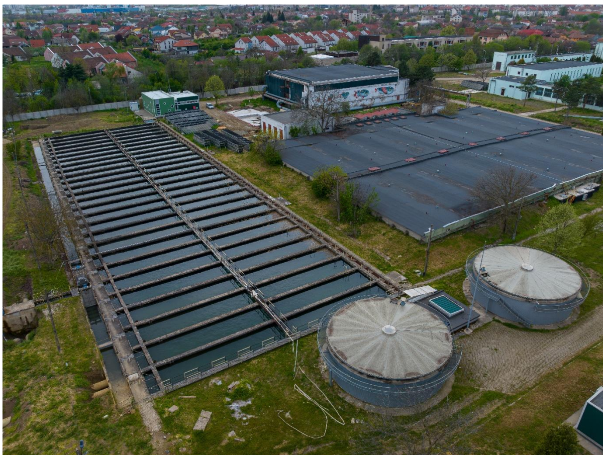
Poza 2. Stația de tratare a apei Bega

Capitalul social majorat al Aquatim S.A. este de 851.931 acțiuni nominative dematerializate, fiecare acțiune având o valoare nominală de 100 lei.